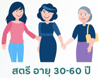
สตรี อายุ 30-60 ปี

การคัดกรองมะเร็งปากมดลูกเป็นนโยบายระดับชาติตั้งแต่ปี 2548 ผู้หญิงไทย อายุ 30-60 ปี สามารถเข้ารับการตรวจคัดกรองด้วยวิธี Pap smear โดยไม่เสียค่าใช้จ่าย และปัจจุบันได้มีการเพิ่มตรวจคัดกรองมะเร็งปากมดลูกด้วยวิธี HPV DNA test เป็นชุดสิทธิประโยชน์