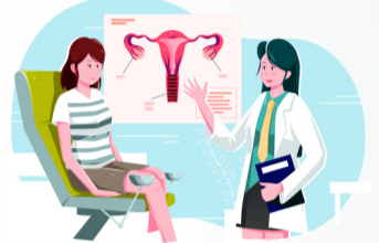
ส่งกล้องปากมดลูก