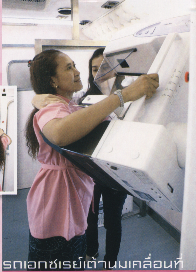
รถเอกซเรย์เต้านมเคลื่อนที่